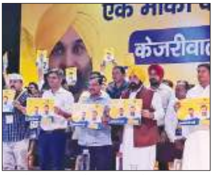
दिल्ली के मुख्यमंत्री व आप सुप्रीमो अरविंद केजरीवाल ने राजस्थान में आम आदमी पार्टी की गारंटी कार्ड लॉन्च किया।